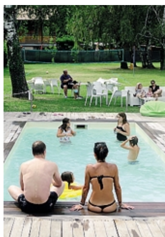
Una piscina interna